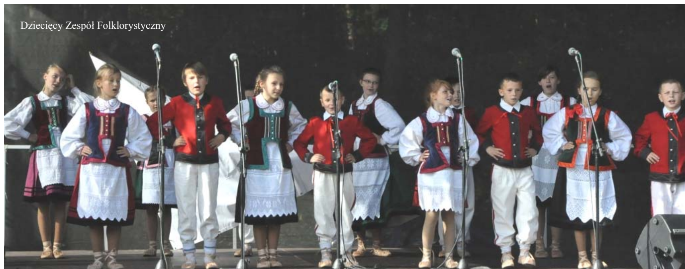
Dziecięcy Zespół Folklorystyczny