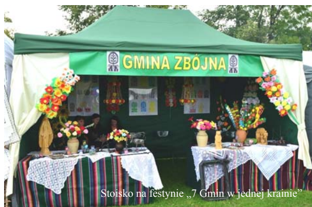
Stoisko na festynie „7 Gmin w jednej krainie”