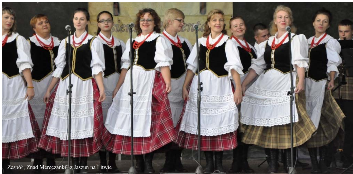
Zespół „Znad Mereczanki” z Jaszun na Litwie

1 września 2013r. w niedzielne wrześniowe popołudnie na stadionie w Zbójnej odbyły się „Prezentacje Kulturalne”. Można było usłyszeć Zespoły Śpiewacze z Turośli, Nowogrodu i Zbójnej. Tańce kurpiowskie zaprezentował Dziecięcy Zespół Folklorystyczny ze Zbójnej. Występy uświetnił zaprzyjaźniony Zespół „Znad Mereczanki” z Jaszun na Litwie, który gościliśmy już wielokrotnie. Publiczność rozbawił przebojowy kabaret „Weźrzesz”.