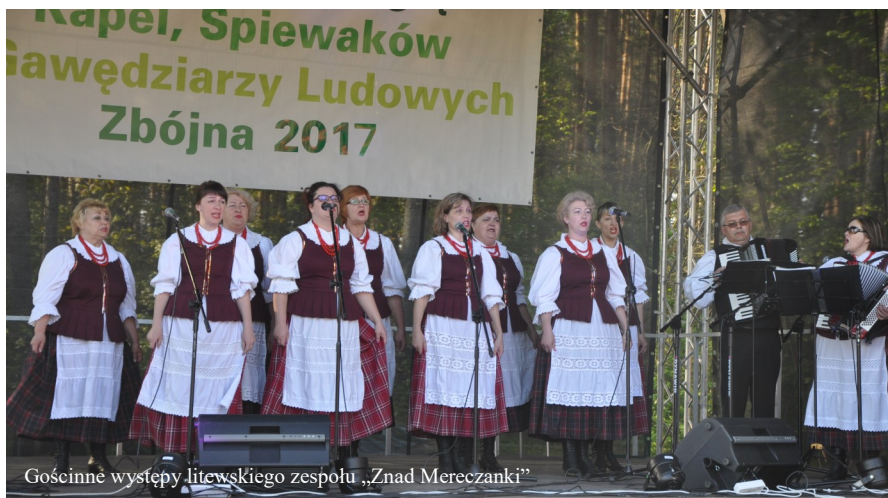
Gościnne występy litewskiego zespołu „Znad Mereczanki”