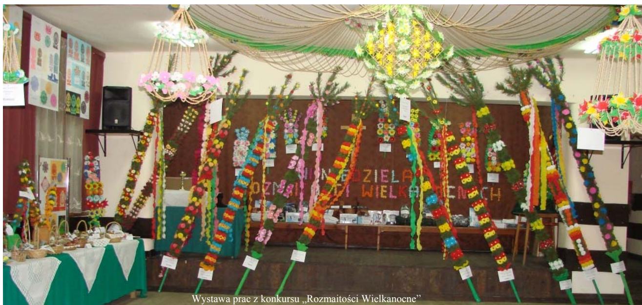
Wystawa prac z konkursu „Rozmaitości Wielkanocne”