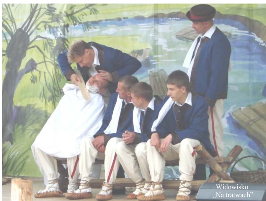
Widowisko „Na tratwach”