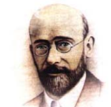
Patron Szkoły Podstawowej w Kuźniach

„Kiedy śmieje się dziecko, śmieje się cały świat”