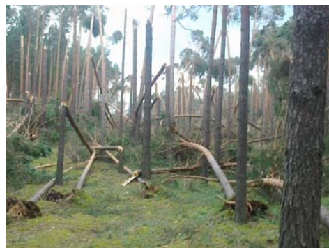
Zniszczony las w Laskach