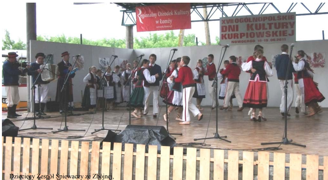
Dziecięcy Zespół Śpiewaczy ze Zbójnej,