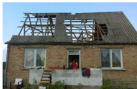
Uszkodzony dom w Gontarzach