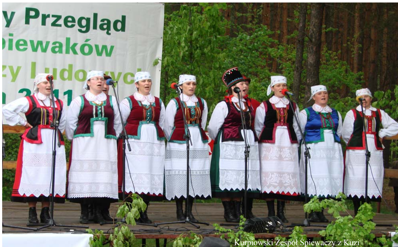
Kurpiowski Zespół Śpiewaczy z Kuzi