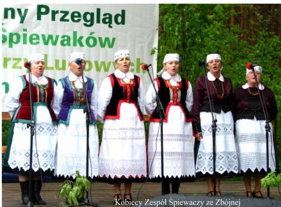
Kobiety Zespół Śpiewaczy ze Zbójnej