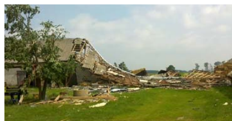
Zniszczona stodoła w Wyku