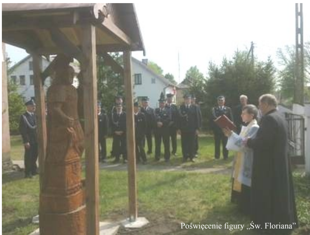
Poświęcenie figury „Św. Floriana”

Z inicjatywy strażaków z OSP Zbójna przy budynku remizy (stare przedszkole) została umieszczona figura św. Floriana patrona strażaków.